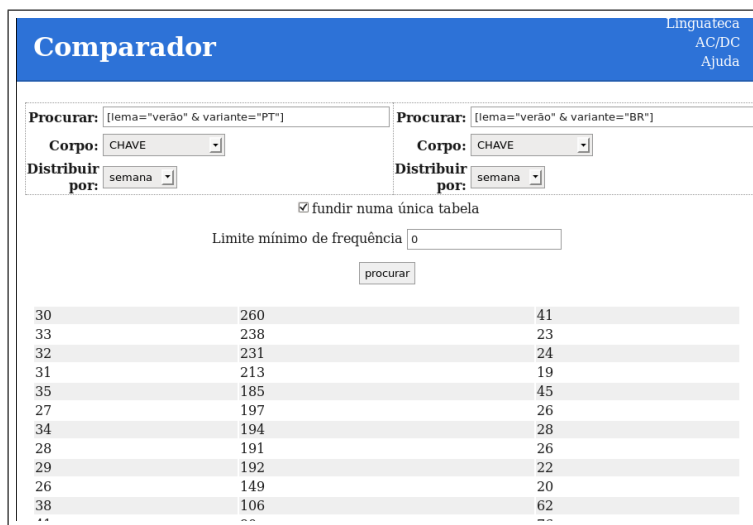
Figura 2. Comparador (versão anterior) usado para analisar a distribuição dos substantivos coocorrendo com duas cores diferentes; Comparador analisando a distribuição de verão por semana.